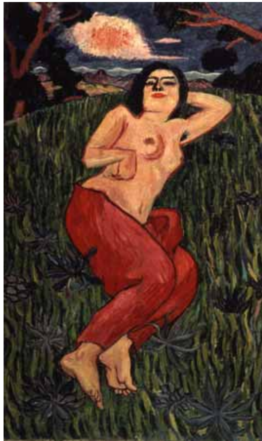
萬鉄五郎（裸体美人） 1912年 重要文化財 東京国立近代美術館蔵