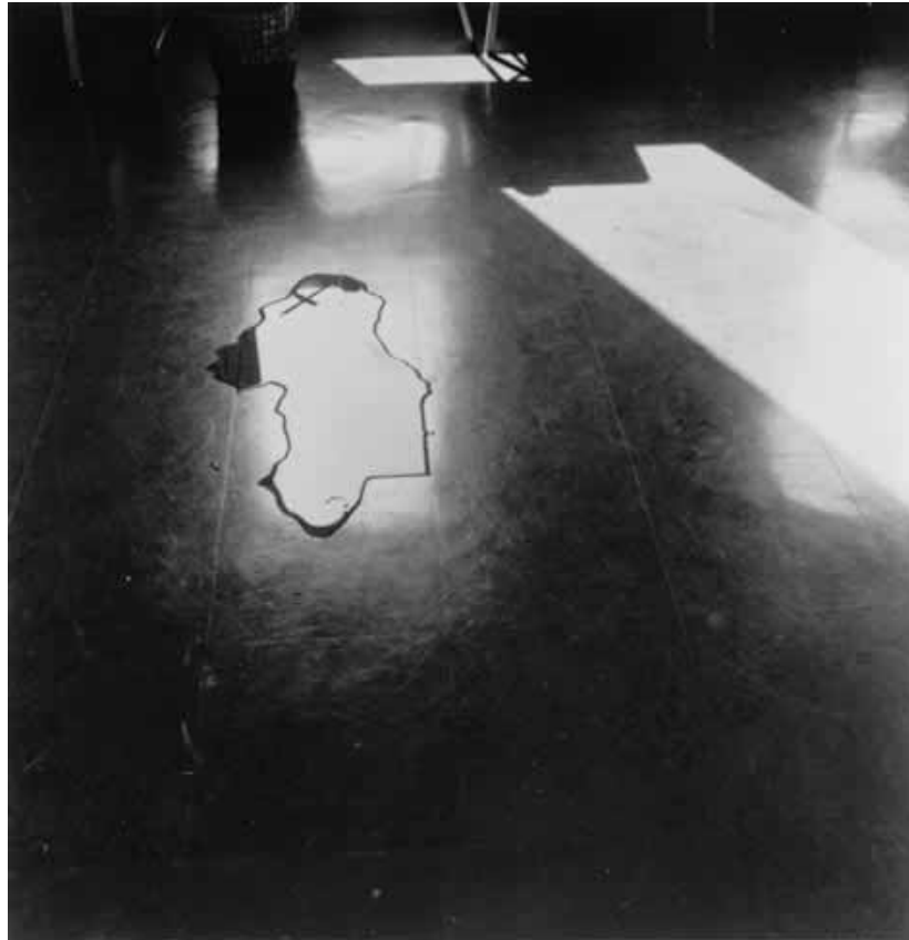
榎倉康二 (P.W.-No.50 予兆 床・水) 1974年(1994年プリント) ゼラチン・シルバー・プリント

東京国立近代美術館は コレクションを中心とした小企画「いみありげなしみ」展を開催します。