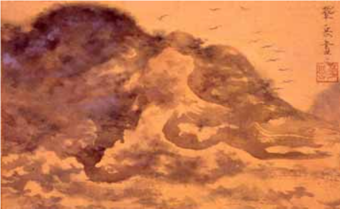
村上華岳 (空山清高之図)