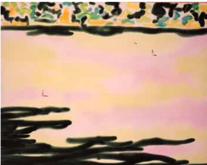
丸山直文 (Garden 1) 2003年

絵画や版画、写真や水彩もまた、面の上に何かが接触して残した「しみ」の集まり。こんな考え方はなんだか奇妙に聞こえるかも知れません。しかしこの展示の最後に、たとえば丸山直文 (Garden 1) ( )を、近い距離から見てください。そこにあるのは、綿布と、その織り目に沿ってじわじわとにじみ、広がる絵具の「しみ」だけ、そんなふうには見えないでしょうか。画面から少し離れて、二人の小さな人物に気がつくと、初めて「しみ」は茂みや木陰に変身し、そこに公園のような広い空間が現れます。