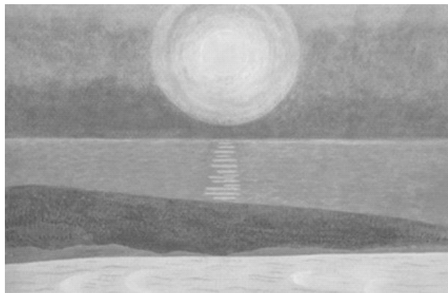
《奥の細道句抄絵 暑き日を海にいれたり最上川》 1976年 京都国立近代美術館蔵