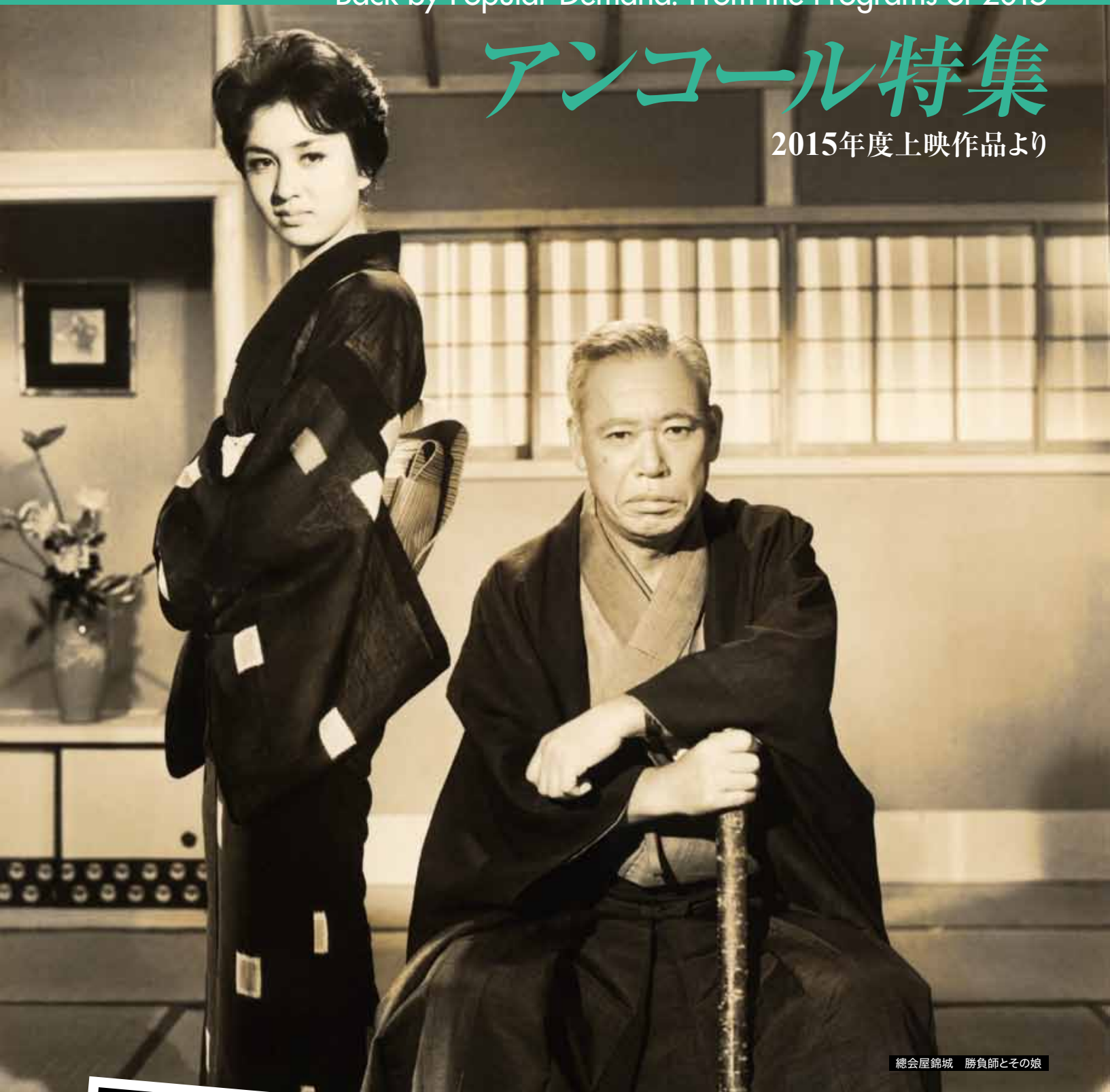
總會屋錦城 勝負師とその娘