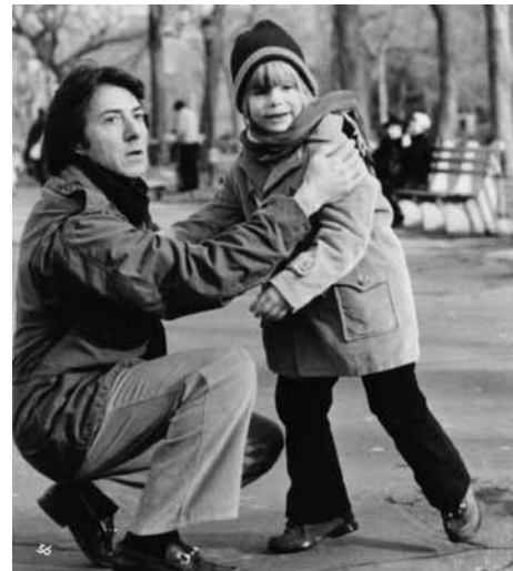
クレイマー、クレイマー