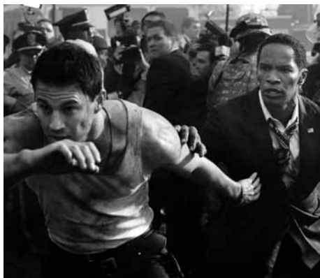
ホワイトハウス・ダウン

2011(SBSプロダクションズ=コンスタンティン・フィルム=SPIフィルム・スタジオ=ヴェルサティル・シネマ=ザナガル・フィルムズ=フランス・ドゥ・シネマ)◎ロマン・ポランスキー ◎ヤスマ・レザ ◎パヴェウ・エデルマン ◎ディーン・タヴォウリス ◎アレクサンドル・デスプラ ◎ジョディ・フォスター、ケイト・ウインズレット、クリストフ・ヴァルツ、ジョン・C・ライリー