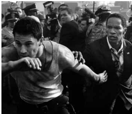
ホワイトハウス・ダウン

2011(SBSプロダクションズ=コンスタンティン・フィルム=SPIフィルム・スタジオ=ヴェルサティル・シネマ=ザナガル・フィルムズ=フランス・ドゥ・シネマ)◎ロマン・ポランスキー ◎ヤスミナ・レザ ◎パヴェウ・エデルマン ◎ディーン・タヴォウラリス ◎アレクサンドル・デスプラ ◎ジョディ・フォスター、ケイト・ウインズレット、クリストフ・ヴァルツ、ジョン・C・ライリー