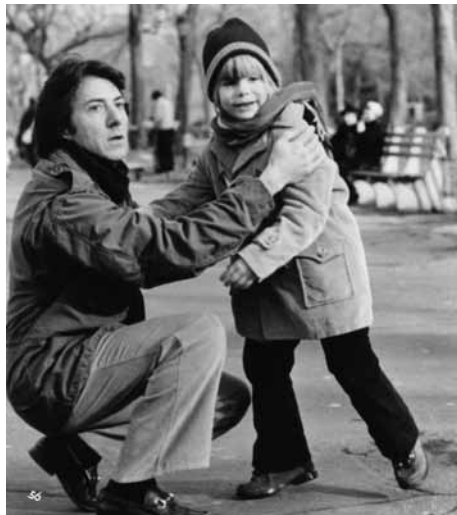
クレイマー、クレイマー