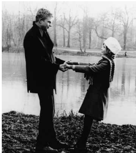
シベールの日曜日