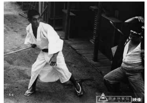
日本侠客伝 斬り込み