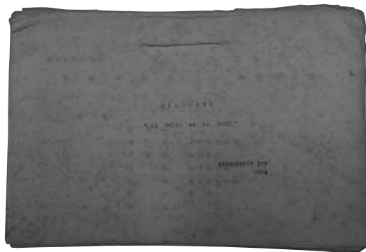
図4 『美女と野獣』(1946年製作)日本語台本 表紙に大岡昇平翻訳の記載あり (Traduction par Ooka)