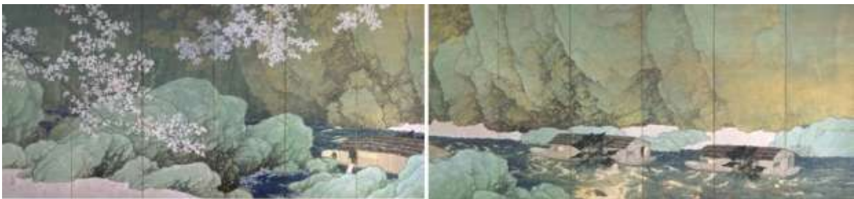
川合玉堂《行く春》1916(大正5)年 重要文化財

※千代田のさくらまつり(主催:千代田区、千代田区観光協会) 3月25日(金)~4月3日(日)予定 桜の開花状況により日程は変更の可能性があります。詳細は主催者ホームページ等でご確認下さい。