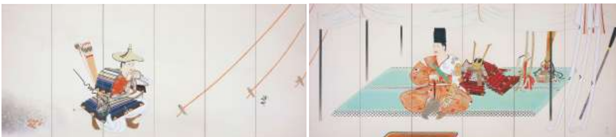
安田鞞彦《黄瀬川陣(きせがわのじん)》1940-41(昭和15-16)年 重要文化財