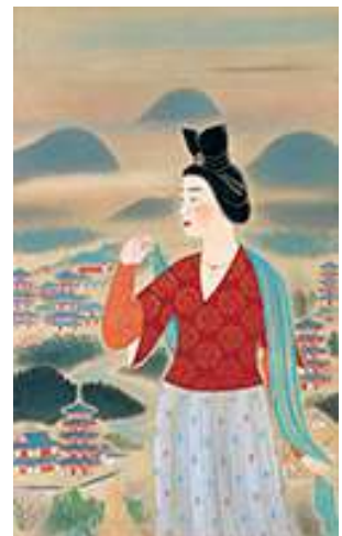
安田靫彦《飛鳥の春の額田王》 1964(昭和 39)年 滋賀県立近代美術館蔵 (4/19 からの期間限定展示)

《飛鳥の春の額田王》《黄瀬川陣》など歴史上の人物や場面を描いた名作の数々で知られる日本画家、安田靫彦(1884-1978)は、岡倉覚三(天心)から直接の薫陶を受けた最後の世代の一人。日本美術院再興に参画し、確かな画技と高い教養を背景に、歴史画に新たなイメージを創出し続けました。当館では 40 年ぶりとなる回顧展で、100 点を超える代表作を集めて靫彦芸術の魅力と特質に迫ります。