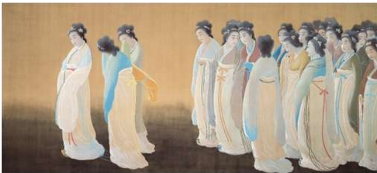
菱田春草《王昭君》1902(明治 35)年 重要文化財 寄託作品[善寶寺蔵](3/23 からの期間限定展示) 山形県鶴岡市の善寶寺から期間限定で寄託を受けています

水面に散る桜を描いた名作 川合玉堂《行く春》をはじめ、菱田春草《賢首菩薩》、《王昭君》(寄託作品 [善寶寺蔵]、3月23日からの期間限定展示)などの重要文化財を一挙公開します。《王昭君》は寄託後初めての公開で、同じく重要文化財の《賢首菩薩》を含めて菱田春草作品 10 点を展示します。さらに「安田靫彦展」に関連して「靫彦★リコメンド」と題し、靫彦がコメントを寄せた日本画を紹介するコーナーも設けます。作品保存のため展示期間が限られるこれらの作品を、まとめてご覧いただけるのは年に一度の貴重な機会です。