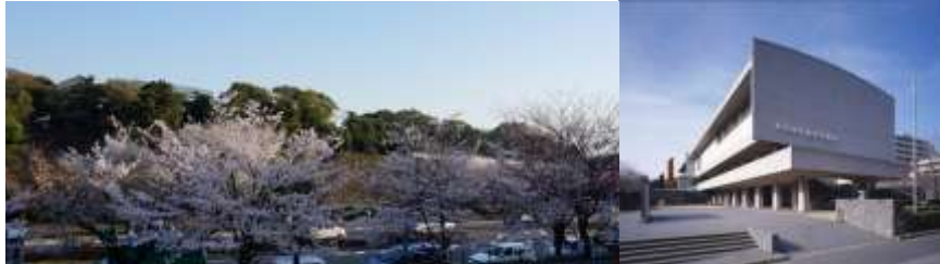
美術館(本館)

MOMAT コレクション 特集「春らんまんの日本画まつり」と「安田鞞彦展」を開催 千代田のさくらまつり関連企画で、レストランのテイクアウト販売やお休み処を開設