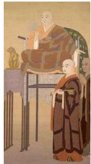
菱田春草《賢首菩薩》 1907(明治 40)年 重要文化財