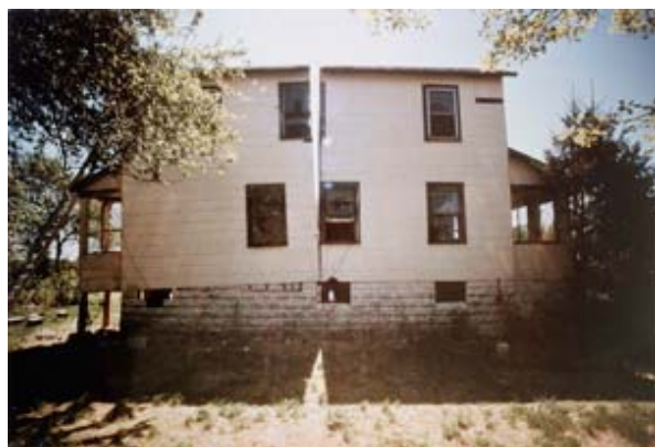
② 《スプリッティング》1974年 ゴードン・マッタ＝クラーク財団&デイヴィッド・ツヴィルナー (ニューヨーク)蔵