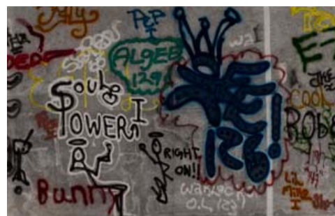
④ 《グラフィティ：ソウル・パワー》1973年 ゴードン・マッタ=クラーク財団&デイヴィッド・ツヴィルナー (ニューヨーク) 蔵

マッタ=クラークは、人や物が行き交うダイナミックな現場、ストリートをしばしば活動の舞台としました。機能的な都市生活に潜む隙間（用途のない小さな土地）や余剰（街にあふれるゴミ、そこかしこの壁に書きつけられたグラフィティ）に注目し、都市のエネルギーの循環や変容を可視化するようなプロジェクトを展開します。