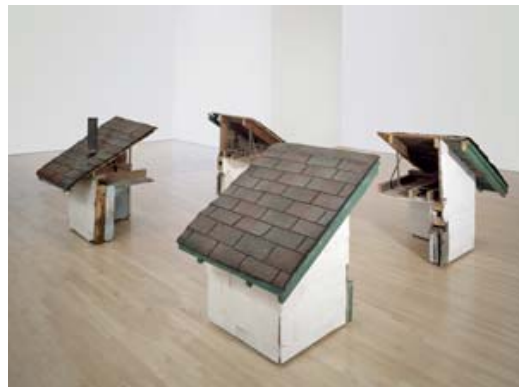
③ 《スプリットティング：四つの角》1974年 サンフランシスコ近代美術館蔵

住まいの確保は、生きる上で最も重要なことの一つです。けれど近代以降、私たちの多くは故郷（ホーム）としての住居をもたず、転々と移り住むことを余儀なくされています。マッタ=クラークにとって重要だったのは、建築のスタイルではなく、人が「住まう」という経験でした。彼は、再開発のなかで建物が取り壊されていくプロセスに介入し、家屋の床や壁を切り取り、穴を穿つことで、捨てられた空間に新たな光を当て、またそこに住んでいた人々の歴史や記憶をも浮かび上がらせました。