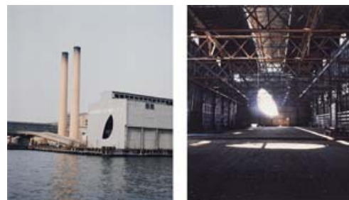
⑤ 《日の終わり》1975年 ゴードン・マッタ=クラーク財団&デイヴィッド・ツヴィルナー (ニューヨーク) 蔵

水と陸の境界に位置する港は、古くから都市が発生する起点となり、人や物の交流によって社会を変化させる力をもつ場所でした。マッタ=クラークは、ニューヨークのハドソン川沿いに並ぶ埠頭でいくつものプロジェクトを行います。水運と鉄道の時代が終わり、すでに荒蕪した埠頭で行われた彼のビルディング・カット（建物切断）やパフォーマンスは、社会にダイナミックな変化を生み出してきた港湾都市の繁栄や衰退を照らし出します。