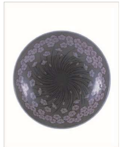
広報用図版 No.9 十三代今泉今右衛門《色鍋島薄墨石竹文鉢》 1982年