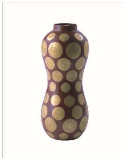
広報用図版 No.5 増田三男《金彩壺 爆ぜる》1997年