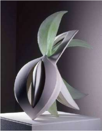
広報用図版 No.2 田嶋悦子《Cornucopia 02-X1》2002年