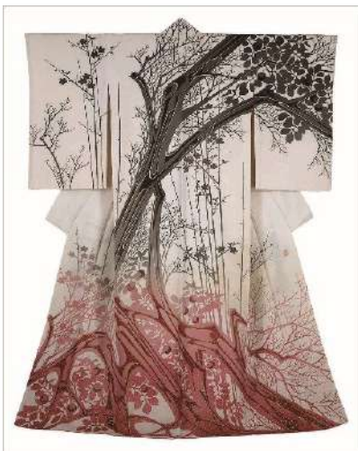
広報用図版 No.7 森口華弘《古代縮緬地友禪訪問着 四季の香》 1959年