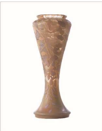
広報用図版 No.4 エミール・ガレ《藤文花瓶》1900-04年頃

熱 : 加工後は500~600度に設定した徐冷炉に入れ、少しず つ常温に戻します。急激な温度低下による割れや 歪みを防ぐためです。