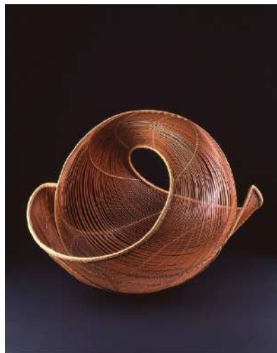
広報用図版 No.8 生野祥雲齋《竹華器 怒濤》1956年