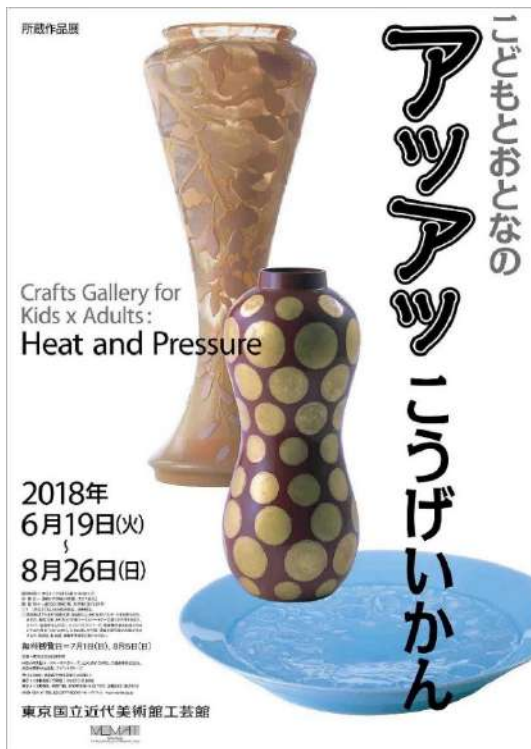
広報用図版 No.1 こどもとおとなのアツアツこうげいかん展ポスター