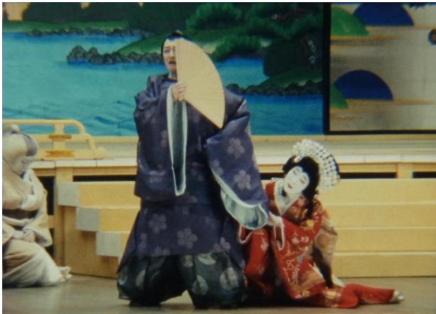
『歌舞伎役者 片岡仁左衛門 人と芸の巻 中巻』

昨年夏に開催した「京橋映画小劇場 No. 34 ドキュメンタリー作家 羽田澄子」に続き、フィルムセンターでは、11月9日（木）より19日（日）まで、羽田澄子監督特集の第2弾を開催します。その中で、羽田監督が名優・十三世片岡仁左衛門（1904-1994）の晩年をとらえた代表的ドキュメンタリー『歌舞伎役者 片岡仁左衛門』6部作（1992-94）を上映することが決定いたしました。