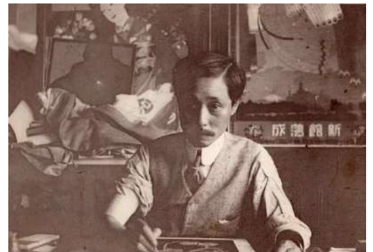
参考図版 杉浦非水（三越呉服店図案部に在りて）1914年