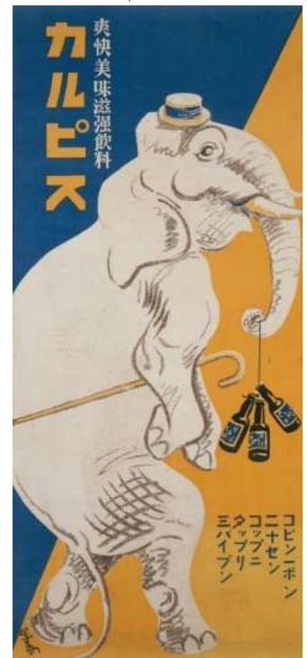
図版No.6 杉浦非水 《カルピス》 1926年