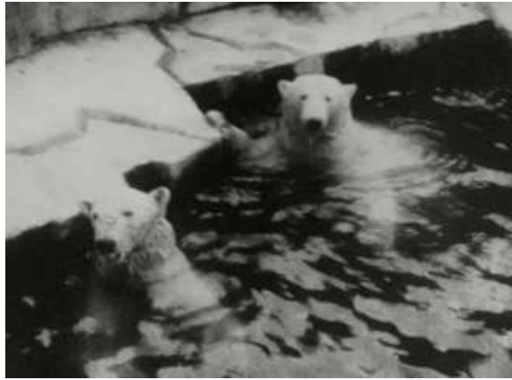
参考図版 杉浦非水撮影による白熊（国立映画アーカイブ所蔵フィルムより）

本展のために新たにデジタル化した国立映画アーカイブ所蔵の16mmフィルムには、非水が創立に関わった光風会の展覧会風景や、親交のあった洋画家・藤田嗣治夫妻とのピクニックの様子、上野動物園の白熊などが映し出されています。