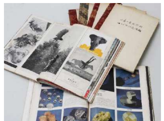
図版No.2 杉浦非水によるスクラップブック

本展ではこれまで図書資料として保管してきた非水の旧蔵資料を初めて展示します。フランスの挿絵入り新聞『L' Illustration（イリュストラシオン）』やアメリカのグラフ雑誌『LIFE（ライフ）』、ヨーロッパで発行されたレイアウトやタイポグラフィに関する豊富な図版をおさめた美術書や雑誌、非水手製の細かく分類された膨大なスクラップは、非水の着眼点や興味の対象を知るための手がかりを与えてくれます。