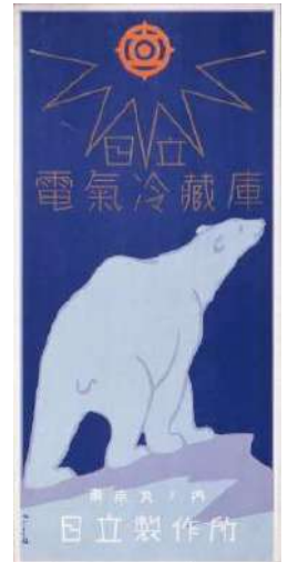
図版No.5 杉浦非水 《日立電気冷蔵庫》 1933年