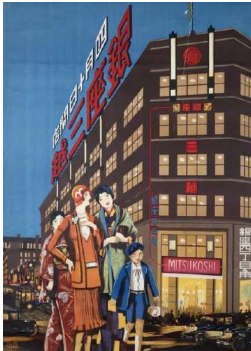
図版No.3 杉浦非水 《銀座三越 四月十日開店》 1930年

とりわけ三越呉服店のための広告デザインにおいて、非水は百貨店としての新たなブランドイメージを創り出す「イメージメーカー」として欠かせない存在であり、「三越の非水か、非水の三越か」と言われるほどでした。非水の図案に見出せる共通点、あるいは図案と非水が収集した資料の共通点から、企業や商品のイメージを決定づけるすぐれた図案がどのように生み出され続けたのか、そのプロセスをうかがうことができます。