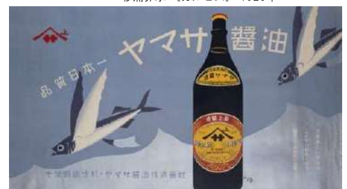
図版No.7 杉浦非水 《ヤマザ醤油》 1920年頃