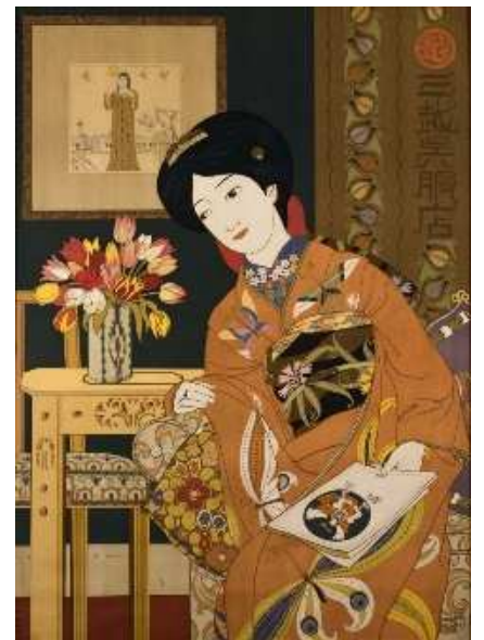
図版No.1 杉浦非水 《三越呉服店 春の新柄陳列会》1914年

本展では非水の活動を大きく4つに分類し、それらの有機的なつながりを展示によってご紹介します。