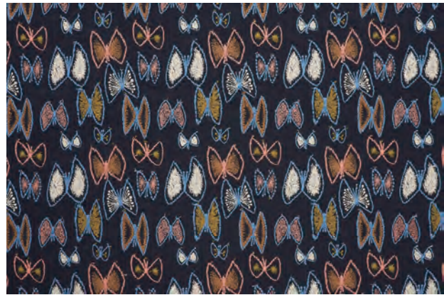
ミナペルホネン 《sky flower》2012年 参考図版

漆を塗った上に沈金刀で細かい溝を彫り、そこに金を沈めて模様を描く、「沈金」は長い間、主に線描の技法として用いられてきました。作者の前大峰（1890～1977）は、明治の中頃から新聞にも登場するようになった、印刷写真の網点 あみてん に着想を得て、沈金に新たに点彫という要素を見いだします。線と点の緻密で繊細な重なりによって、動物の毛並みや植物の筋、そのかすかな陰影など、自然のモチーフをより立体的に、質感豊かに表しました。