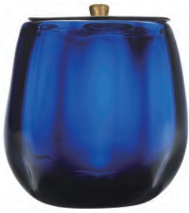
岩田藤七 《水指 彩光》1976年 広報用図版②

またガラス作家の岩田藤七 (1893-1980) は、昭和初期から茶道具のなかに、ガラスという新しい素材を持ち込み、時代の感覚をモノに反映しようと試みました。暮らしに寄り添うモノを静かに見つめ直し、「今」の感性をみいだし更新していく営みは、過去から未来へと私たちをつないでくれます。現代では、夏に涼を求めてガラスの茶碗が用いられることも見られるようになりましたが、ガラスの茶道具は今日においても一般的ではありません。東洋陶磁器で目を肥やし、「日本ならではのガラス」づくりをめざした岩田は、早くも昭和14年の個展でガラスの茶道具を発表しています。透明ガラスを最高の美とした当時の社会の常識的評価に挑戦し、宙吹き色ガラスにこだわり、「色の岩田」と言われ、色彩の巧みさが高く評価されました。