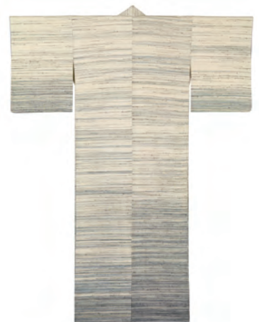
志村ふくみ《紬織着物 水煙》1963年 広報用図版①

この着物は、布を織る過程で、白糸のなかに藍色の濃淡で染めた色系を直感的に織り込んでいく作業から生まれます。水煙の情景が志村氏のなかで、独特の色系のグラデーションに変換されるのです。