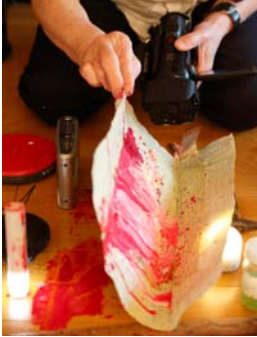
① <怪物君>を制作する吉増剛造 2015年

貸出ご希望の場合は画像番号をお知らせくださるか、別紙申込書をご利用ください。 画像掲載の際は、画像貸出時にお送りしますキャプションをご記載ください。