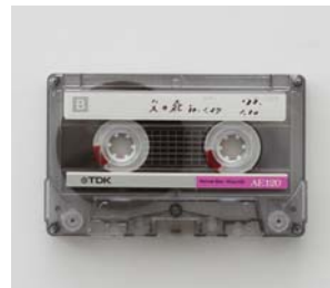
⑨ <声ノート>より「父の死」1987-88年