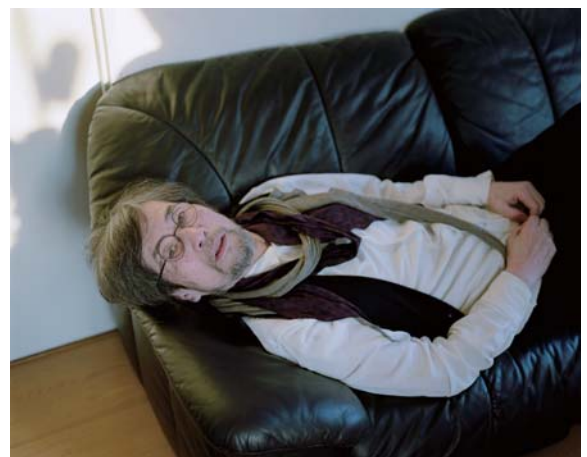
ポートレート(吉増剛造)2009年