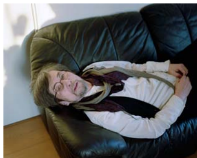
⑫ ポートレイト(吉増剛造) 2009年