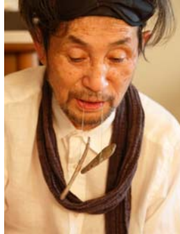
② サヌカイトを口にくわえる吉増剛造 2015年