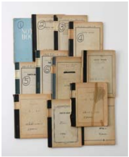
④ <日記>より 1961-64年