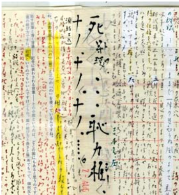
⑦ <裸のメモ>より(部分) 2013年 ©Gozo Yoshimasu