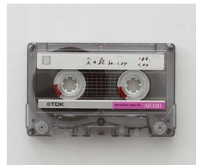
〈声ノート〉より「父の死」1987-88年

2006年(67歳)に誕生した、無編集を基本とする吉増版ロードムービーは、「gozoCiné」(ゴーズーシネ)と命名され、今日に至るまで吉増のライフワークのひとつに加わります。厳選した約10本をスクリーニングします。