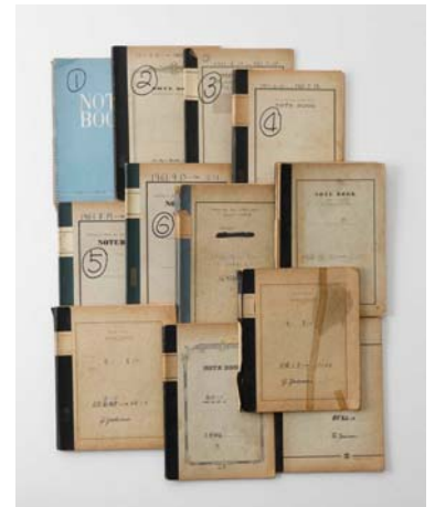
〈日記〉より 1961-64年

吉増は日記魔でもあります。この展覧会では、詩人としてデビューする前の1961年(22歳)の頃から2011年までの日記を公開します。詩のメモや、まるで水彩のような色使いがされたスケジュール表など、吉増ならではの日記帳です。