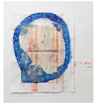
⑥ <怪物君>より 2014年 ©Gozo Yoshimasu