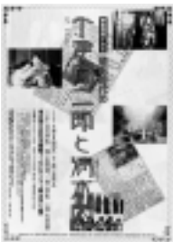
映画資料でみる 蒲田時代 の小津安二郎と清水宏 2p