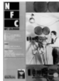
□2004年2-3月号 シリーズ・日本の撮影監督 (1) 6p