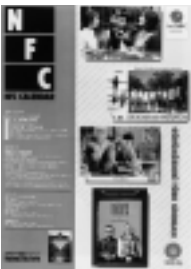
□2003年10月号 トルコ映画の現在 4p