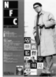
□2003年8月号 映画監督 市川崑 (1) 4p