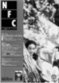
□2003年4-5月号 逝ける映画人を偲んで1998- 2001 (2) 4p