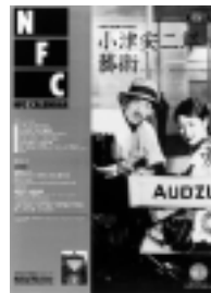
□2003年12月-2004年1 月号 小津安二郎の藝術 6p