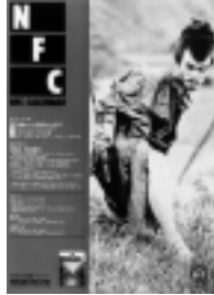
□2003年6-7月号 発掘された映画たち2003 4p