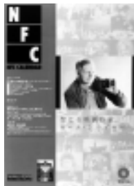
□2003年11月号 聖なる映画作家、カール・ドライ ヤー 4p