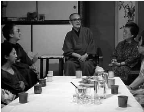
歌舞伎役者 片岡仁左衛門 人と芸の巻 下巻