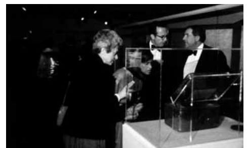
日米文化交流の記録 —1983年—

1981 企画：映画「早池峰神楽の里」をつくる会 | 製作：岩波映画 ☉☉ 羽田澄子 ☉工藤充 ☉西尾清、瀬川順一、若林洋光、西山東男、田代啓史、内藤雅行、下平正巳、千葉寛 ☉久保田幸雄 ☉秋山邦晴 ☉川久保潔