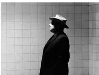
ジャン=ピエール・メルヴィル、『リスボン特急』の頃