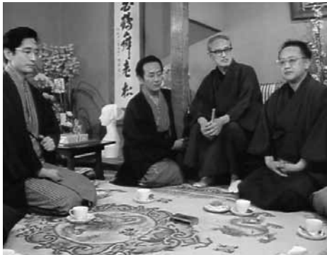
歌舞伎役者 片岡仁左衛門 孫右衛門の巻