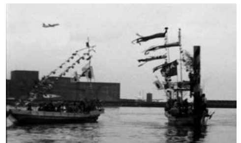
大田区につたわる無形文化財