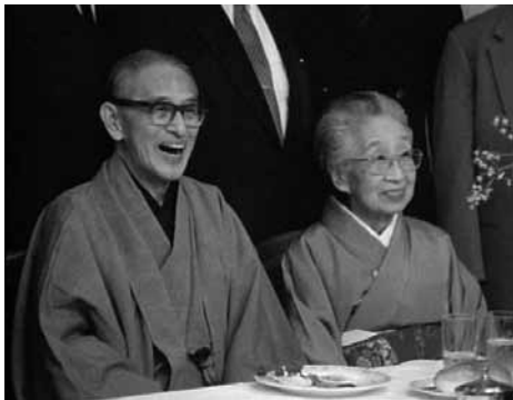
歌舞伎役者 片岡仁左衛門 登仙の巻