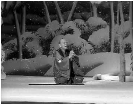
歌舞伎役者 片岡仁左衛門 孫右衛門の巻