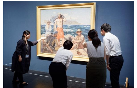
所蔵品ガイドの様子