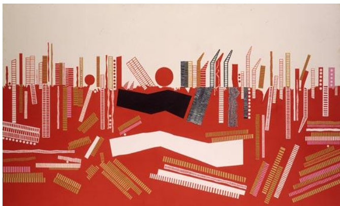
猪熊弦一郎《驚く可き風景(B)》1969年