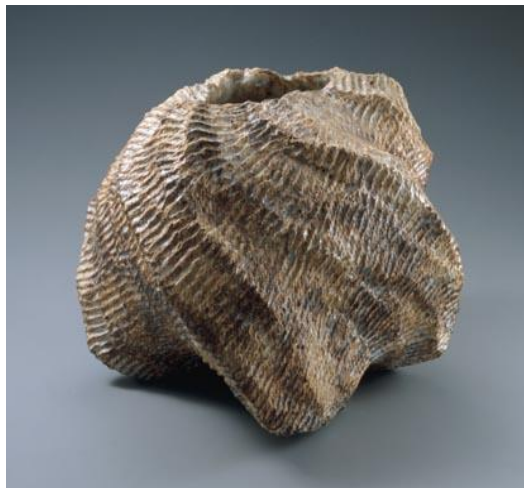
岡部嶺男《練込志野縄文花器》1956年