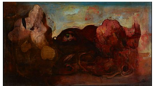
巖光《眼のある風景》1938年