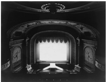
[2] 杉本博司《カポット・ストリート・シネマ、マサチューセッツ州》1978年 © Hiroshi Sugimoto / Courtesy of Gallery Koyanagi