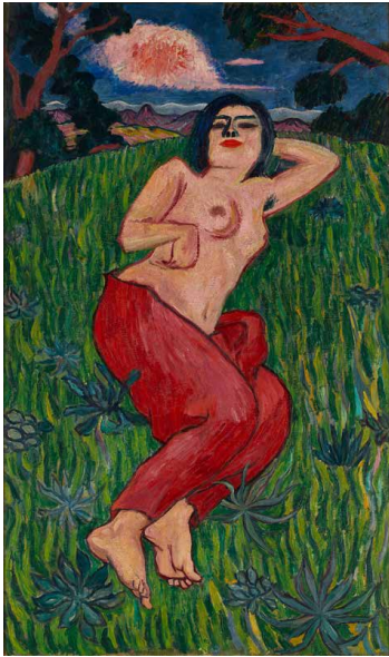
[1] 萬鉄五郎 《裸体美人》1912年、重要文化財