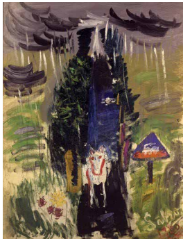
[3] 長谷川三郎 《オルレアン街道の雨》1930年