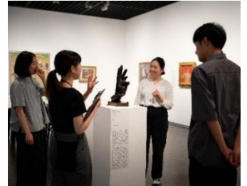
7.参加型プログラムイメージ

7月23日（木）、8月1日（土）、8日（土）、13日（木）、20日（木）、27日（木）、 9月3日（木）、10日（木） 10:30-12:00-（各回30分）