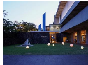
3. 美術館外観イメージ