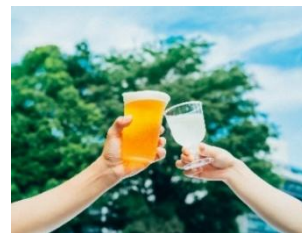
2. キッチンカーメニューイメージ