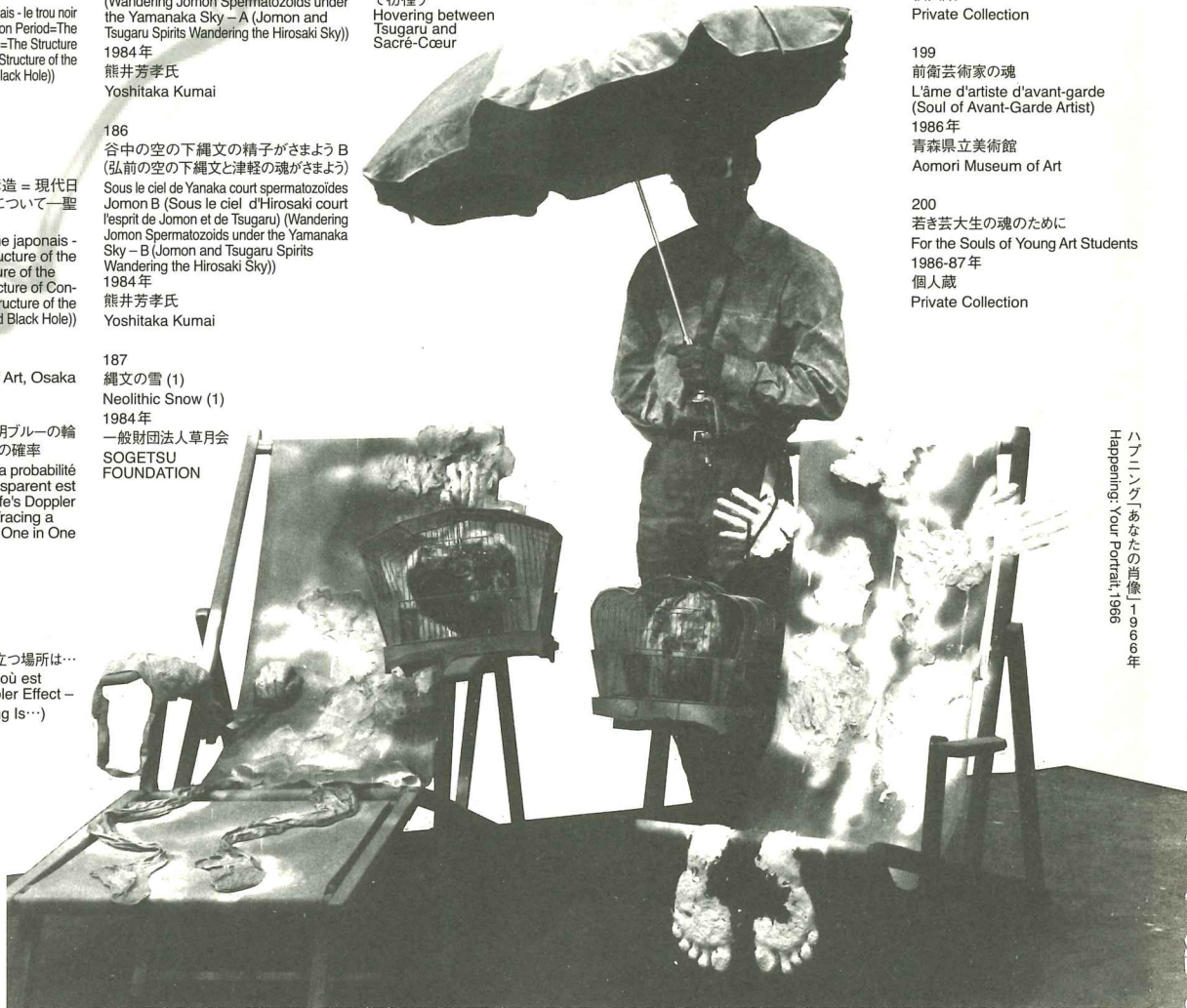
ハブ「ハンダ」あなたの肖像」1986年 Happening: Your Portrait 1986