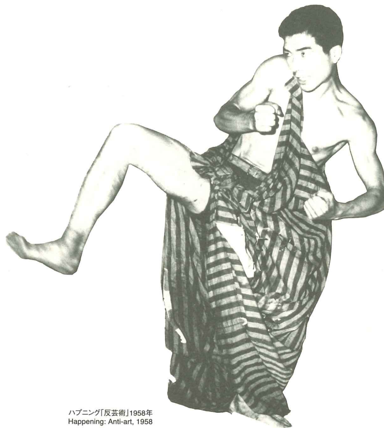
ハプニング「反芸術」1958年 Happening: Anti-art, 1958