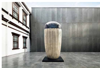
金子潤《無題 13-09-04》2013年