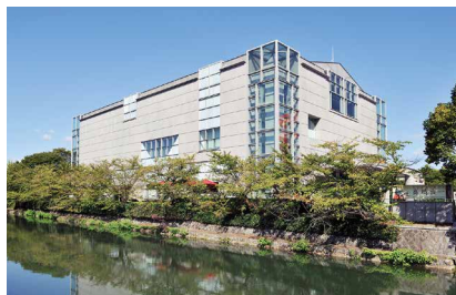
京都国立近代美術館