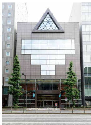
国立映画アーカイブ