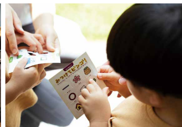
Family Day こどもまっと