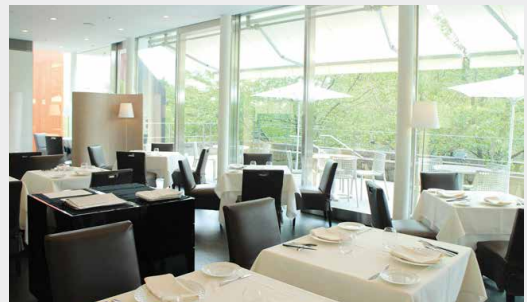
レストラン「ラー・エ・ミクニ」