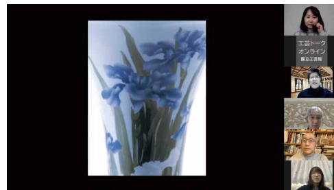
工芸トークオンライン