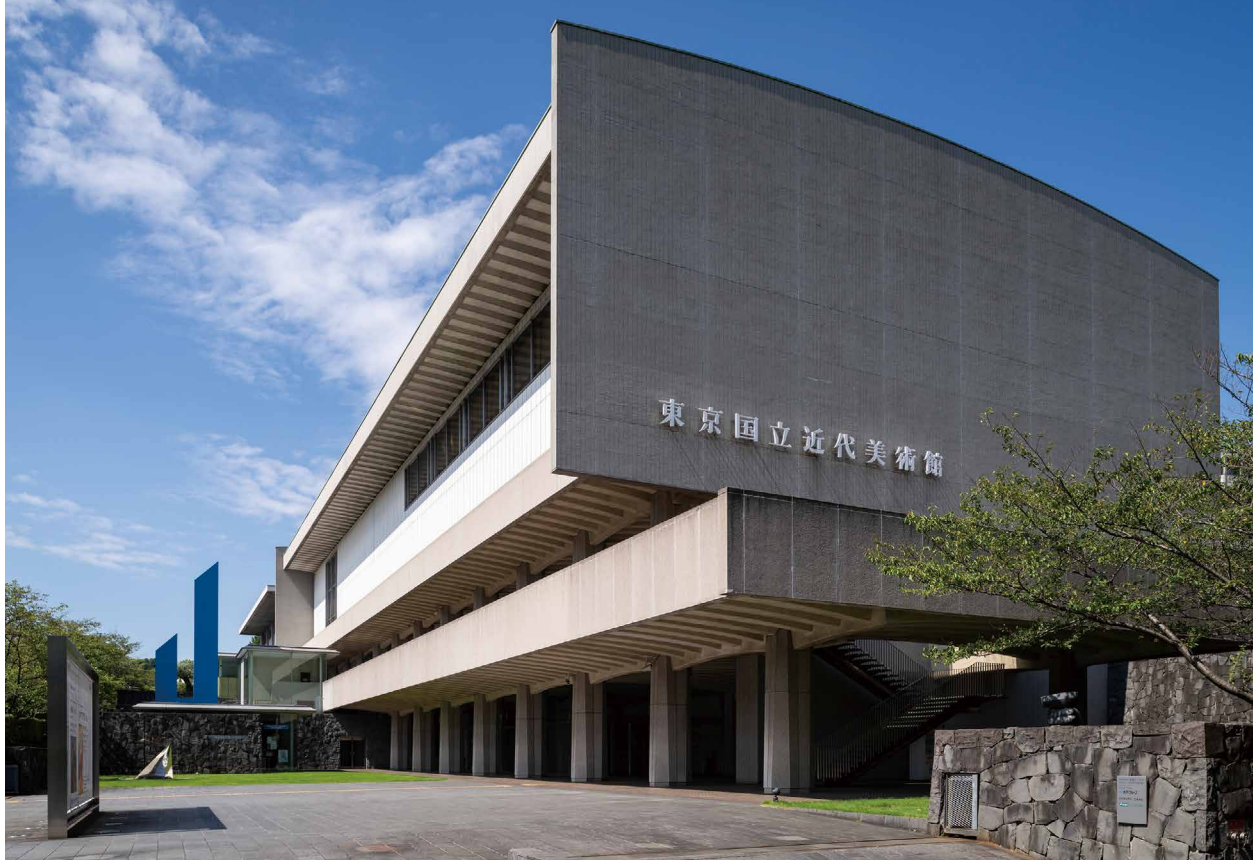
東京国立近代美術館