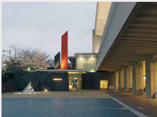
エントランスロビー、前庭でのレセプションの様子(上) 前庭(下)