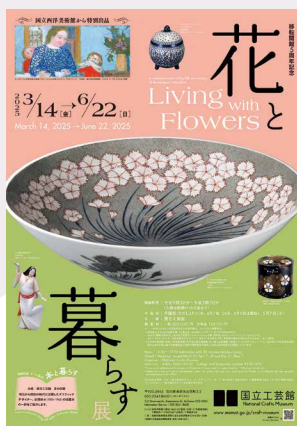
「花と暮らす展」ポスター