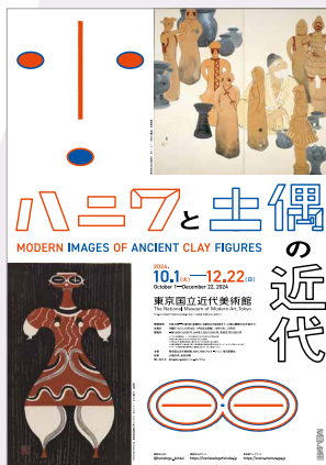
「ハニワと土偶の近代展」ポスター

館の様々な事業を実現させるため、また来館者のニーズに応え、より快適で充実した観覧環境を提供するため、設備の維持・改善や全体の広報、調査などを含めた運営管理を行っています。