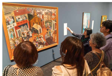
所蔵品ガイド