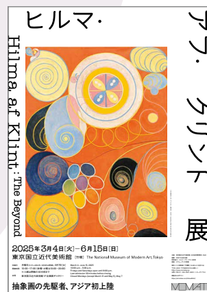
「ヒルマ・アフ・クリンテ展」ポスター