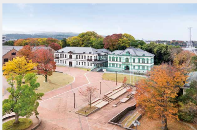
国立工芸館外観