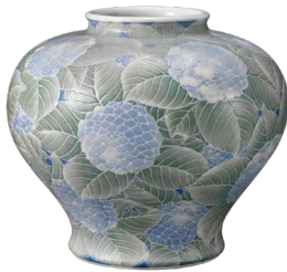
板谷波山《彩磁紫陽花模様花瓶》1915年

国立工芸館では、明治以降今日までの日本と外国の工芸およびデザイン作品を収集しています。特に、多様な展開を見せた戦後の作品に重点を置いています。陶磁、ガラス、漆工、木工、竹工、染織、人形、金工、工業デザイン、グラフィック・デザインなどの各分野にわたって総数4,000点以上を収蔵しています。