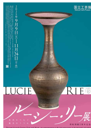
「ルーシー・リー展」ポスター