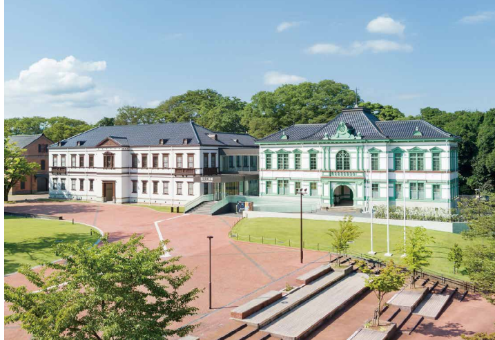
国立工芸館 外観

建物は明治期に建てられた国登録有形文化財の旧陸軍第九師団司令部庁舎と旧陸軍金沢偕行社を移築し、過去に撤去された部分や外観の色などを復元して活用しています。