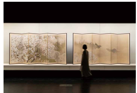
所蔵作品展4階

美術館の周辺には、皇居、北の丸公園、千鳥ヶ淵など、自然豊かな環境が広がっており、いずれも国内有数の桜の名所であることから、特に春には地域一帯が華やかに賑わいます。東京駅から徒歩でもお越しただけ、一年を通じて美術館と併せた散策が楽しめます。