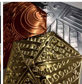
ワークショップ (ピカ☆ボコバッジ)