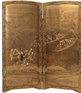
作者不詳《渡船・雨宿柴山象嵌屏風》 明治時代