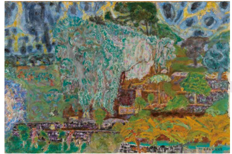
ピエール・ボナール《プロヴァンス風景》1932年